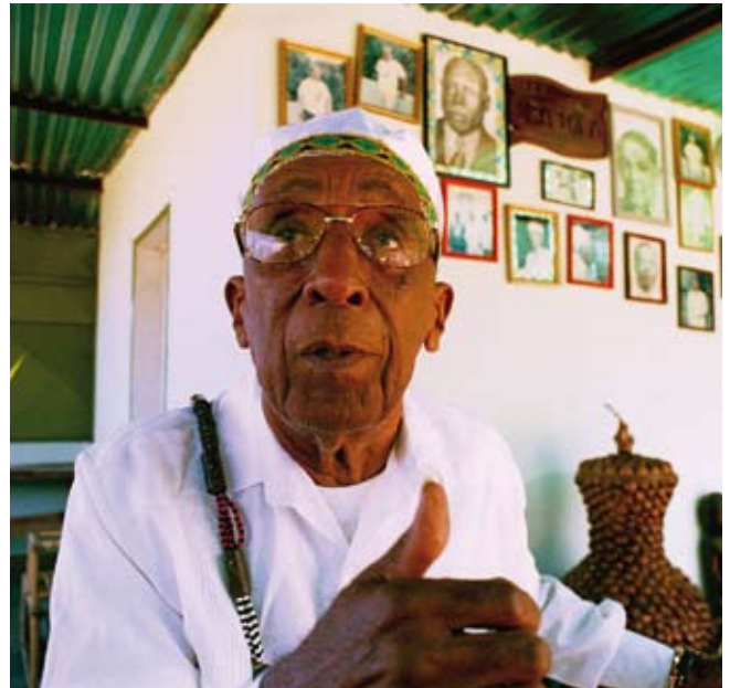
Babalao, sacerdote máximo de la Santería

1 por más que: no matter how 2 prender: to light 3 testigo de Jehová: Jehovah's witness 4 tapar: to cover 5 reposar: to rest, lay 6 mediador: mediator 7 crucifijo: crucifix 8 revoltoso: rebellious, disobedient 9 adepto: follower 10 variopinto: miscellaneous, diverse 11 abanico: range, array 12 fe: faith 13 surgir: to arise, emerge 14 lira: lyre 15 codearse con: to hobnob, rub shoulders with