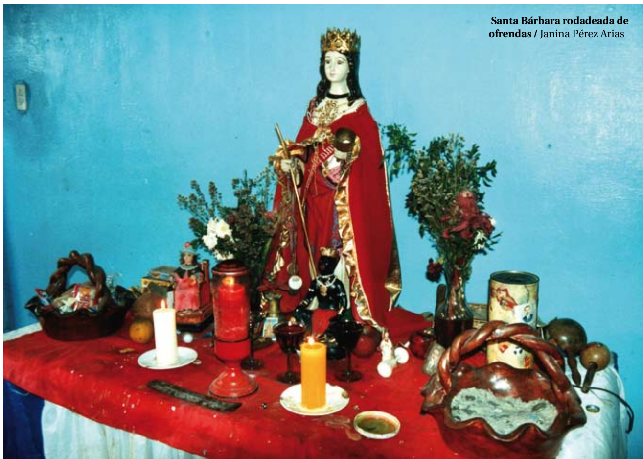
Santa Bárbara rodeada de ofrendas

Catolicismo, cristianismo, protestantismo, judaísmo y ocultismo son los grupos principales que dominan el panorama religioso de América Latina, un continente que no para de creer ni de sufrir por más que 1 se le prendan 2 velas a los santos. Texto Janina Pérez Arias